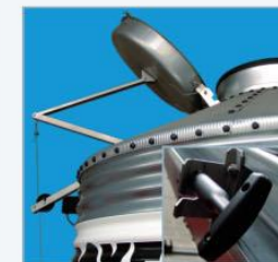
Mehaničko punjenje i ručica za otvaranje