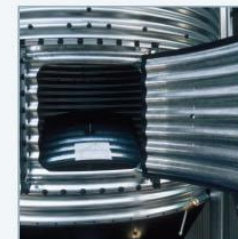
Ulazni otvor silosa